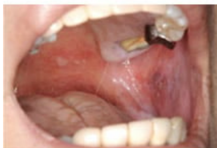
Gr.2 口蓋と左頬粘膜に潰瘍