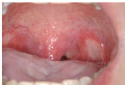
Gr.2 左軟口蓋部の潰瘍