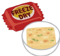
インスタントスープ (1袋)