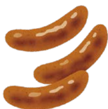
ウインナーソーセージ (1本)