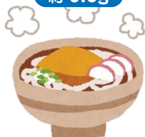
うどん (1杯、汁を含む)