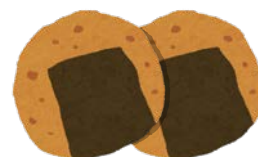
かた焼き せんべい・大 (2枚)