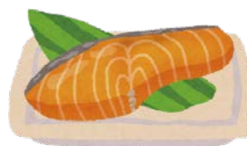
塩鮭・甘塩(甘口) (1切れ)