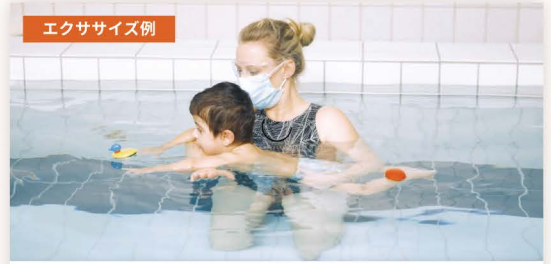
上半身を伸ばすタミータイム